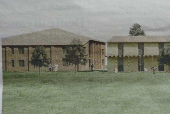
Una ricostruzione virtuale di una parte del progetto edilizio